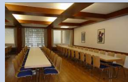
Evang. Gemeindehaus – Kleiner Saal – ca. 60 Personen