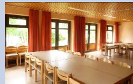
Haus der Kirche – ca. 40 Personen