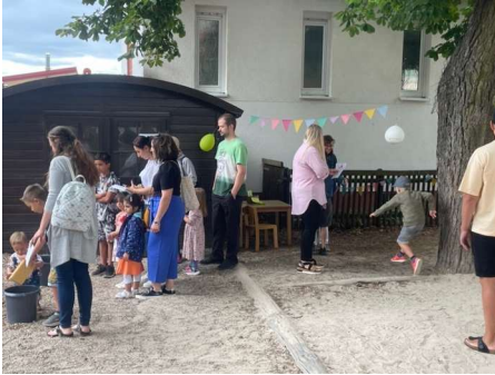
Unser Sommerfest am 01. Juli 2023