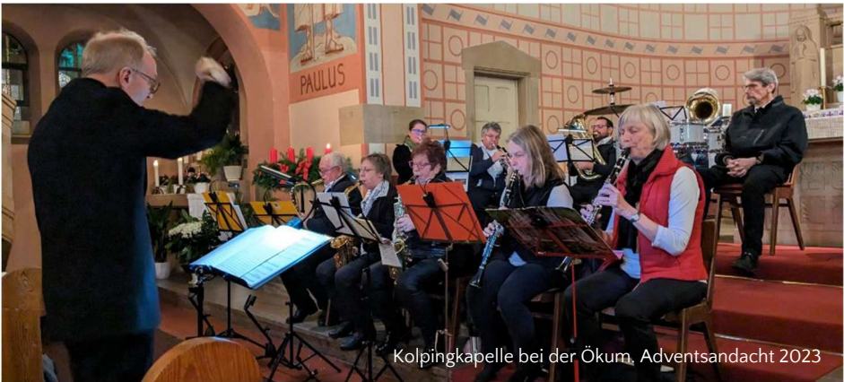
Kolpingkapelle bei der Ökum. Adventsandacht 2023

Guter Gott, nur du allein bist meine Hoffnung. Du bist der einzige Grund meiner Zuversicht.